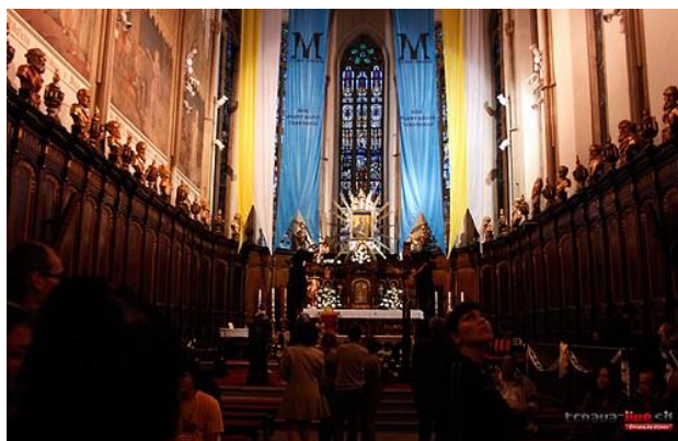
Oltár Baziliky sv. Mikuláša